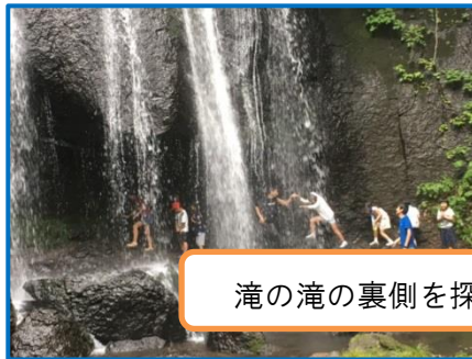
滝の滝の裏側を探検