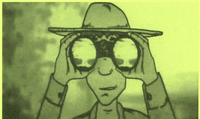
第五福竜丸から西方を見る船員