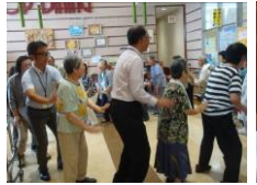
コープこうべの皆さんが来訪され交流