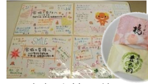
京都生協の皆さんからのメッセージとお菓子