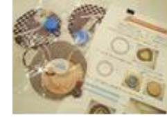
大阪府連の皆さんからの手作りキット