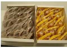
ならコープ有志の皆さんからの南三陸町のお菓子