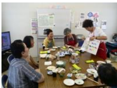
ユーコープしずおか県本部の皆さんからの“脳活ドリル”に取り組みました